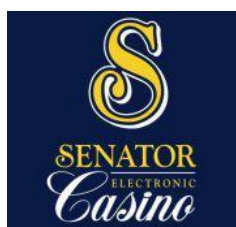
Adria Casino d.o.o.